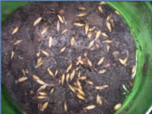
Через 2 дня