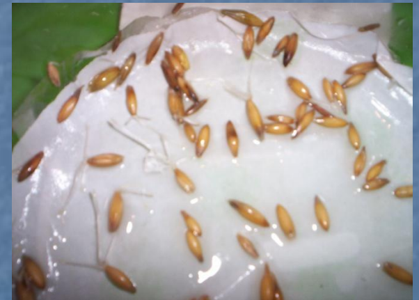
Через 2 суток

■ Результаты: через сутки семена набухли. Через 2 суток большинство семян проросли.