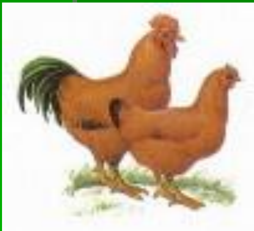
Нью – Гемпшир.