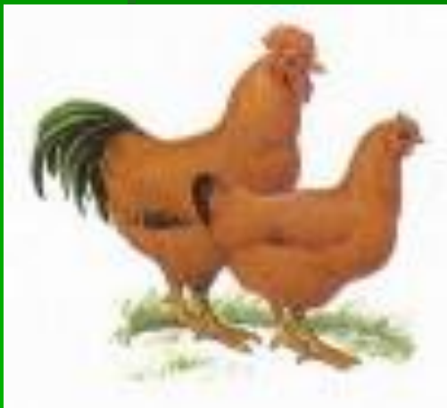
Нью – Гемпшир.