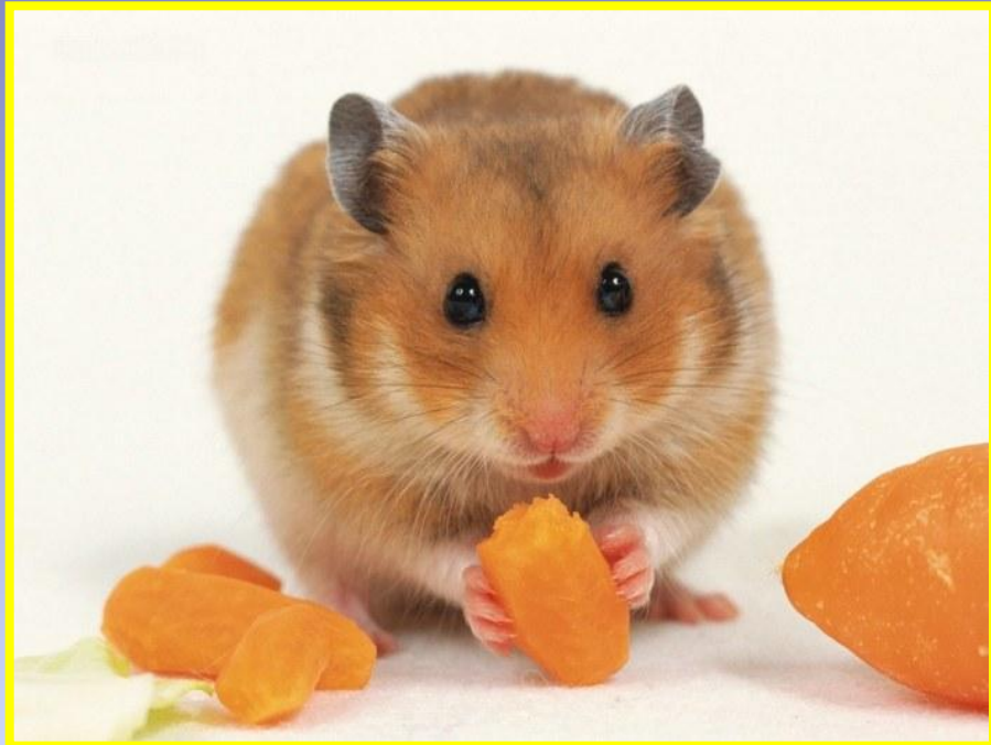
Хомяк золотистый (сирийский)