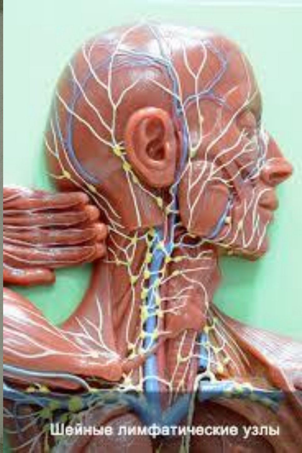
Шейные лимфатические узлы