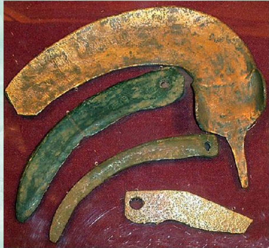
Бронзовые орудия труда. 1 тыс. лет до н.э.

Важнейший фактор эволюции человека - труд. Способность изготавливать орудия труда свойственна только человеку. Животные могут лишь использовать отдельные предметы для добывания пищи (например, обезьяна использует палку, чтобы достать лакомство). Трудовая деятельность способствовала закреплению морфологических и физиологических изменений у предков человека, которые называют антропоморфозами .