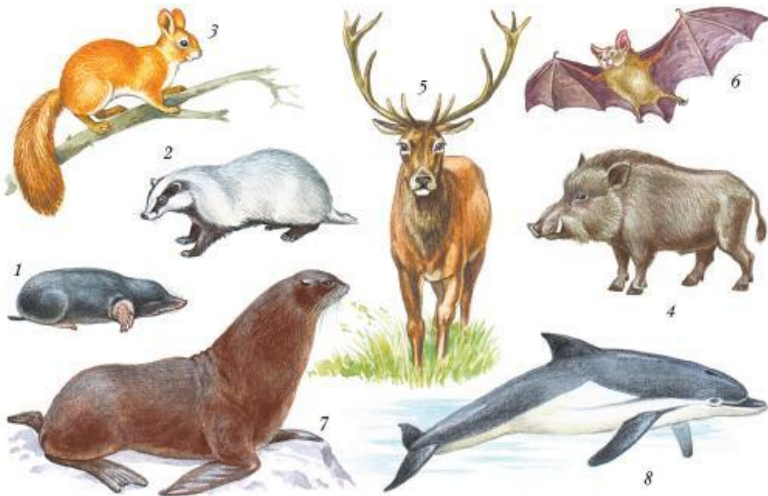
Рис. 219. Экологические группы зверей. I – роющие: 1 – крот; 2 – барсук; II – лесные: 3 – белка; 4 – кабан; 5 – благородный олень; III – летающие: 6 – летучая мышь; IV – плавающие: 7 – морской котик; 8 – дельфин