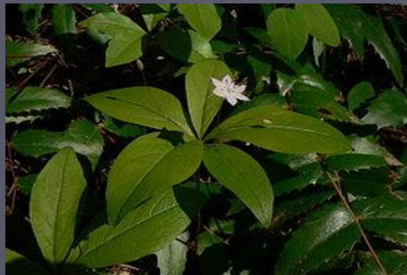
Седмичник (сырые леса)