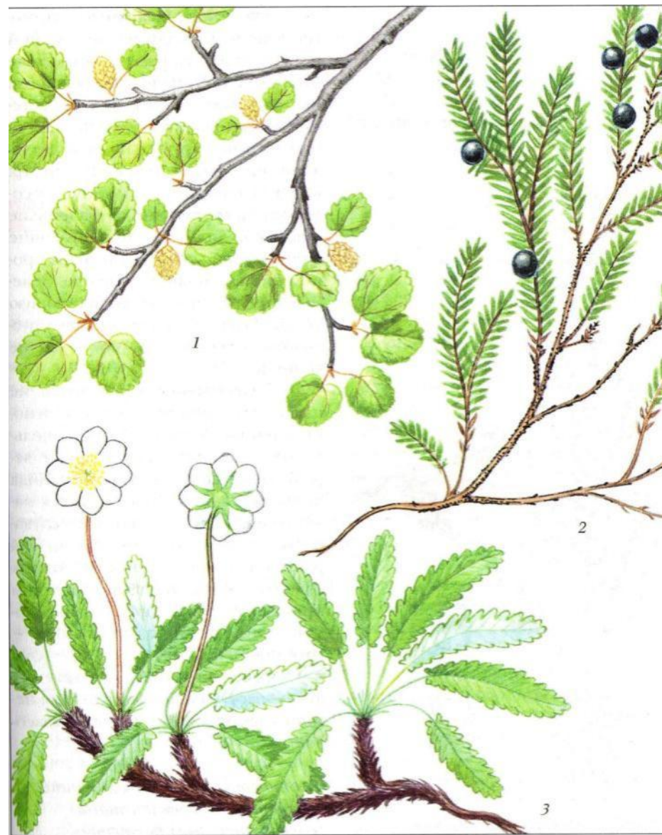
Рис. 43. Тундровые растения: 1 – карликовая березка; 2 – водяника; 3 – куропаточья трава