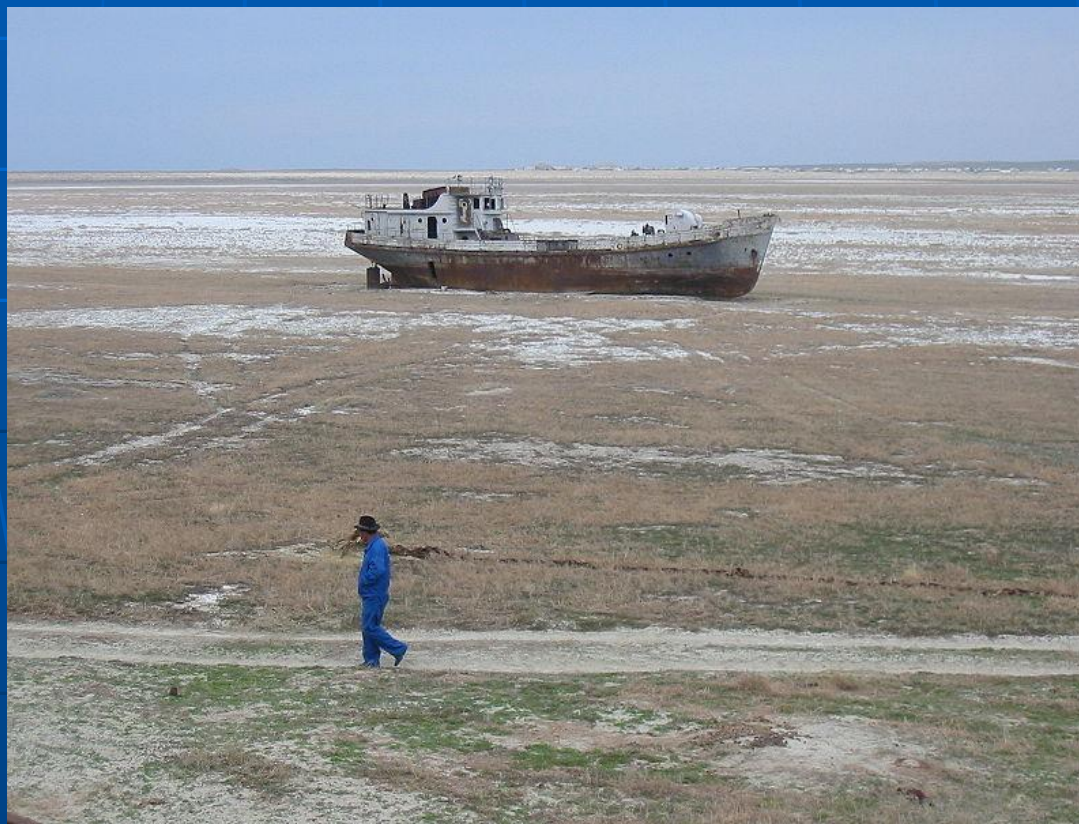
Казахстан. Аральское море. 2003 год.