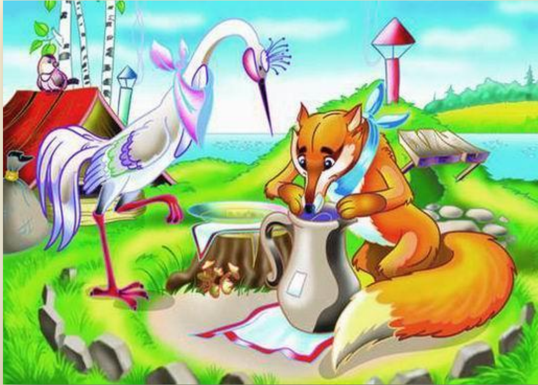
Сказка «Лиса и журавль»

Выявляется разница в строении ротовых аппаратов у разных видов животных, связанная со способами питания. Разнообразие строения животных помогает им приспособиться к различным условиям жизни.