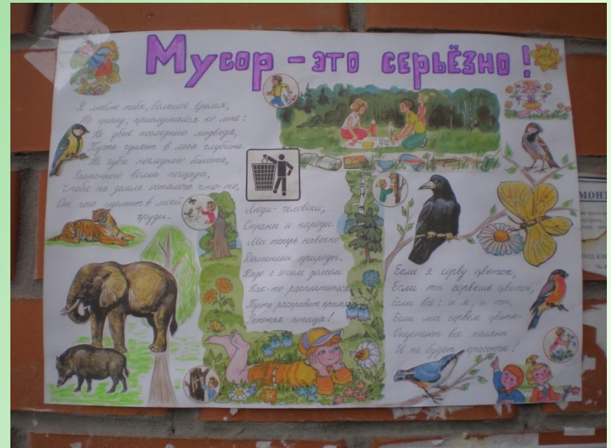
автор Лобынцев Влад 4 «Б»