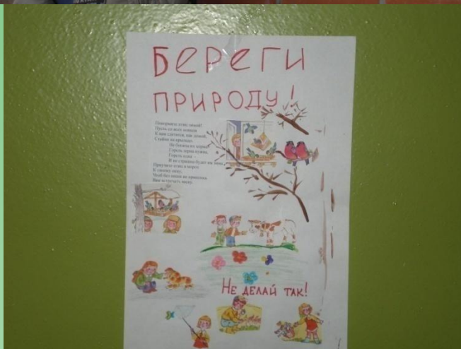
автор Сорокина Маша 4 «Б»