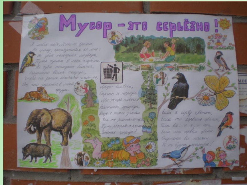
автор Лобынцев Влад 4 «Б»