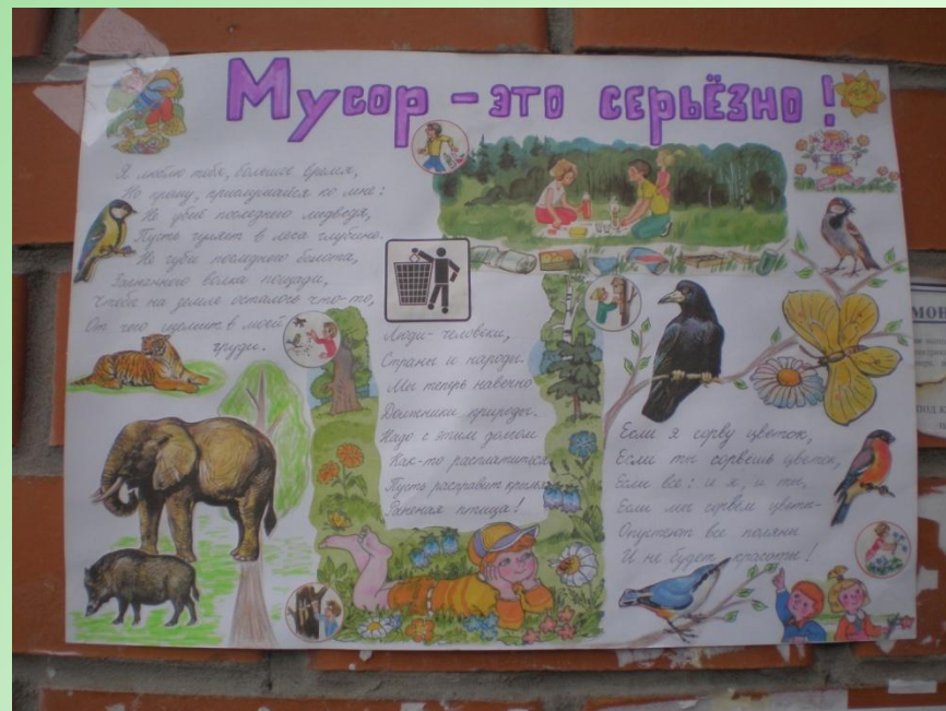
автор Лобынцев Влад 4 «Б»