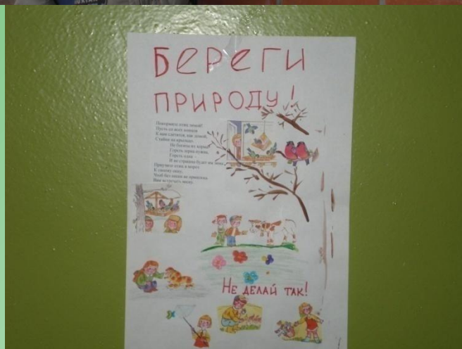
автор Сорокина Маша 4 «Б»