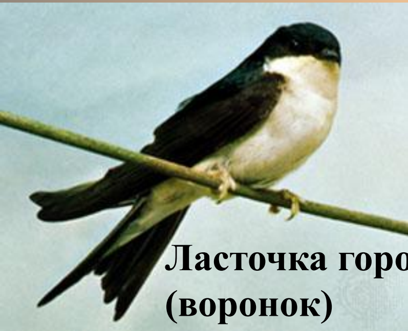
Ласточка городская (воронок)