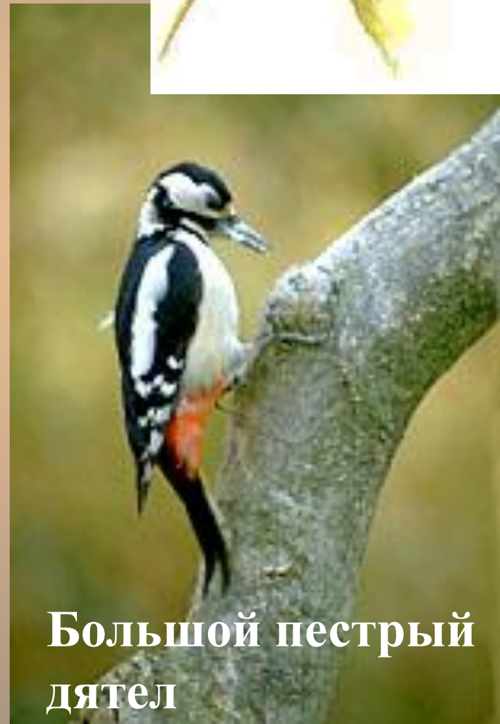
Большой пестрый дятел