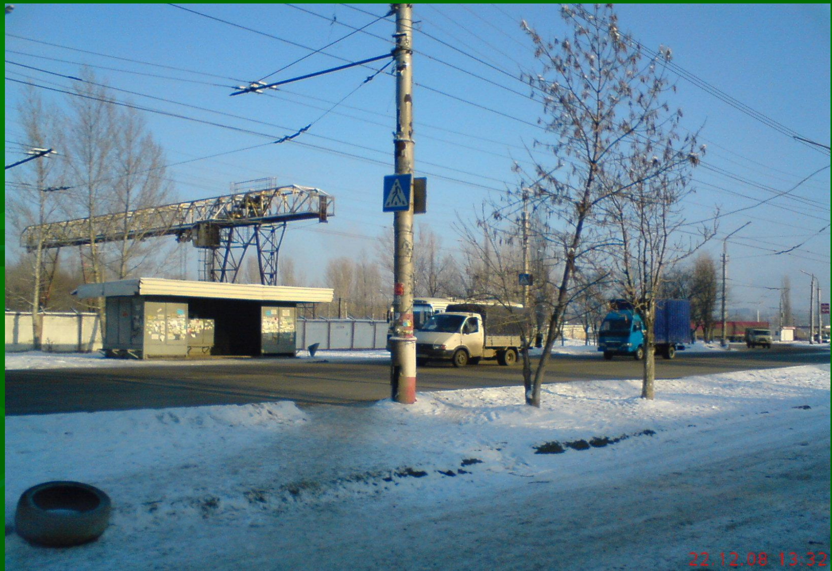
Московское шоссе (на втором плане завод ЖБиК).