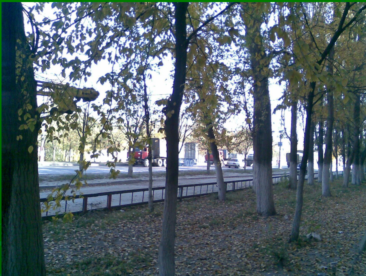
Участок 3В, деревья возле Московского шоссе.