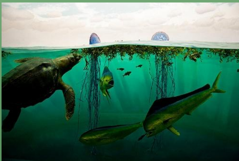
Фото из Саргассово море

Саргассово море ни на одно другое море не похоже. Его стоячие воды уже давно порождают многочисленные легенды и фантастические рассказы. Оно ограничено не континентами, а сильными атлантическими течениями.