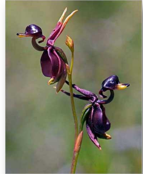
Утконосная орхидея: вся жизнь — обман

Известен родственник под именем радужный эвкалипт . У этого необычного растения кора раскрашена во все цвета радуги, что делает его похожим на туземную красавицу, облаченную в пестрые праздничные наряды.