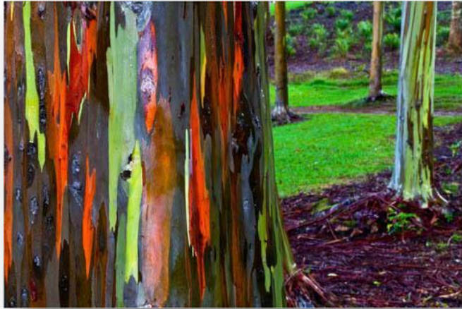
Радужный эвкалипт: абстрактные картины в австралийских лесах

Известен родственник под именем радужный эвкалипт . У этого необычного растения кора раскрашена во все цвета радуги, что делает его похожим на туземную красавицу, облаченную в пестрые праздничные наряды.