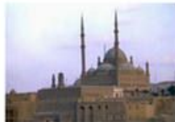
Мечеть Мухаммеда Ама, Кааба, Египет