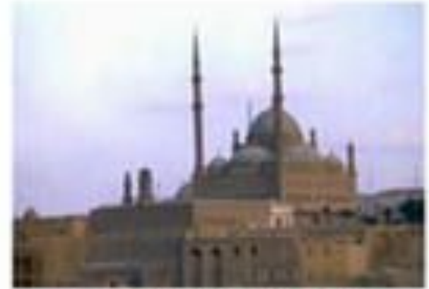
Мечеть Мухаммеда Ама, Кааба, Египет