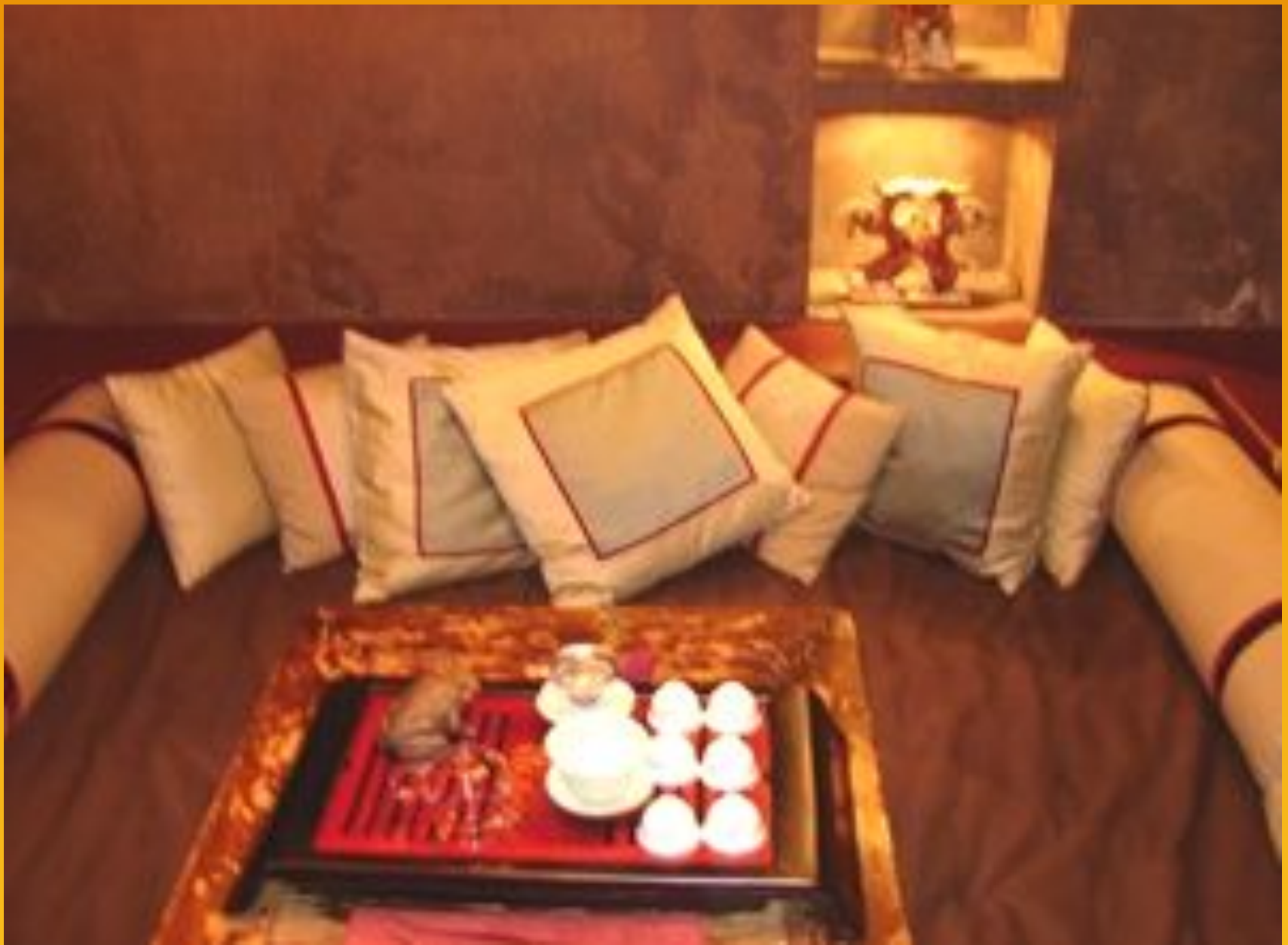
Комната для чаепития