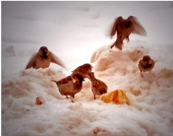
Внутривидовая конкуренция за пищу

Обе формы конкуренции возможны как между особями одного и того же вида как ( внутривидовая конкуренция ), так и между особями разных видов ( межвидовая конкуренция ). факультатив