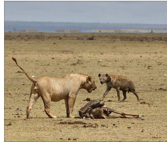
Межвидовая конкуренция за пищу