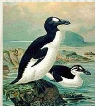
Бескрылая гадарка была истреблена в середине 19 века.