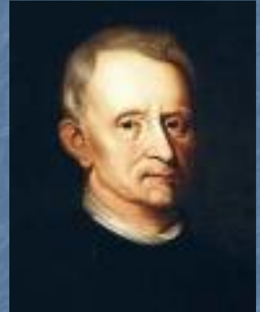
Ян ван Гельмонт

Ян ван Гельмонт поставил первый эксперимент по изучению питания растений.