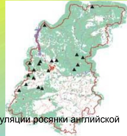
Плотность популяции росянки английской

Как измерить численность популяций рыб, которые недоступны для прямого наблюдения, или популяции организмов, обитающих в почве, живущих в труднодоступных условиях, а также совершающих значительные и нерегулярные миграции? В этом случае наилучшим показателем, который можно использовать для измерений популяционного обилия, является плотность.