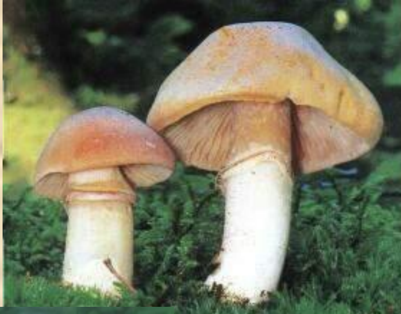
Колпак кольчатый (съедобен)