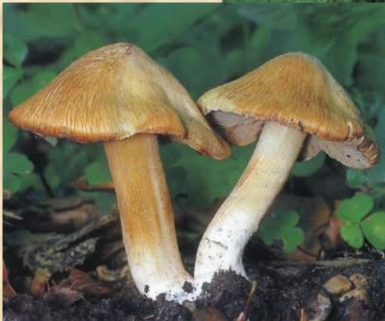
Волоконница (смертельно ядовита)