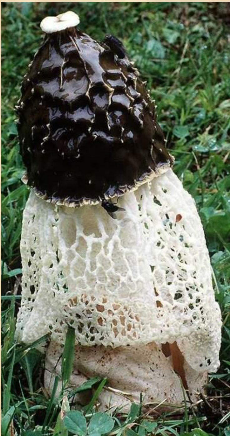
Дама под покрывалом (диктиофора)