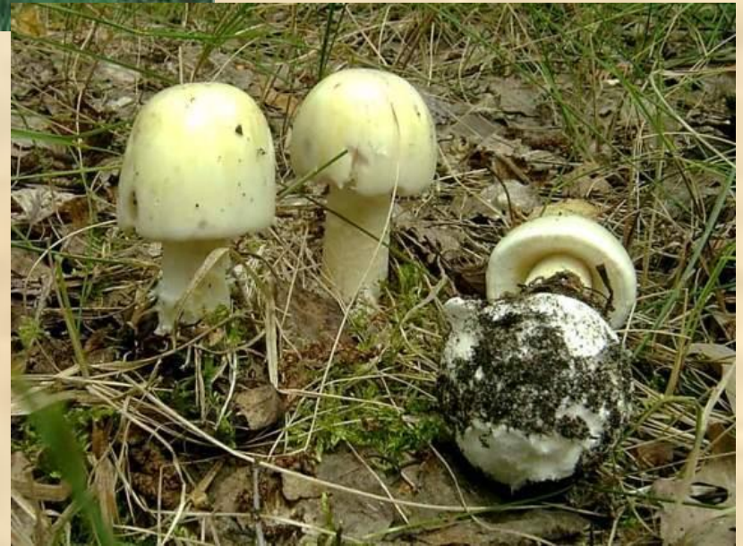
Бледная поганка (смертельно ядовита)