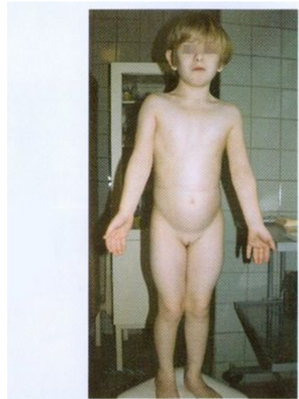
Рисунок 16. Больная 13 лет. Синдром Шерешевского-Тернера. Низкий рост, отсутствие вторичных половых признаков