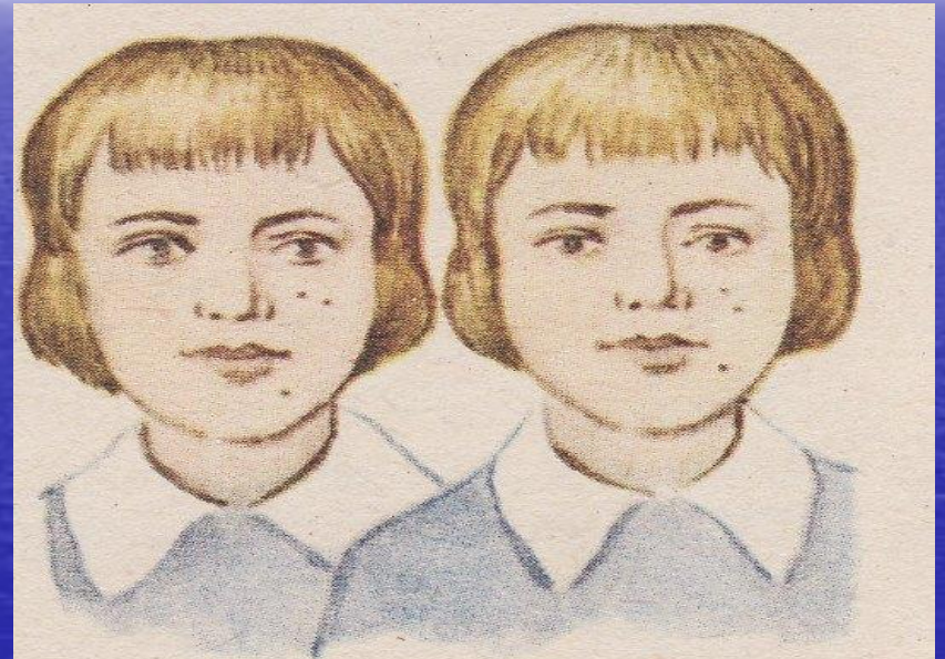
Рис. 44. Сходство в расположении родинок у идентичных близнецов