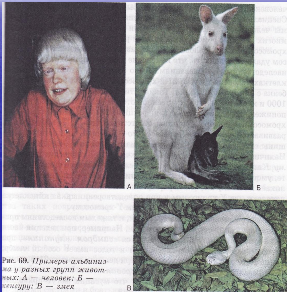
Рис. 69. Примеры альбинизма у разных групп животных: А — человек; Б — кенгуру; В — змея

Если к болезни приводит возникающий в результате мутации рецессивный ген аутосомы, говорят об аутосомно-рецессивном наследовании заболевания. Так наследуется альбинизм – врожденное отсутствие пигментации кожи, волос и радужки глаза. Такое отклонение возникает только у рецессивных гомозигот ( aa ) по данному признаку. В случае рождения гетерозиготной особи ( Aa ) действие рецессивного гена не проявляется.