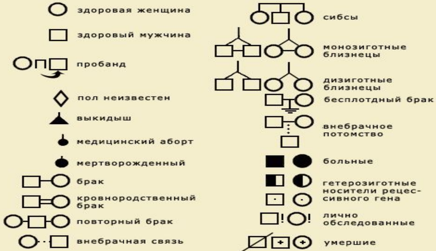
Рис. 7.6 Символы, используемые при составлении родословных