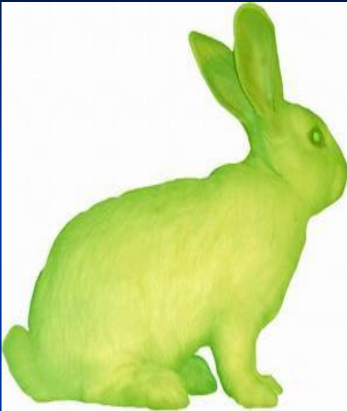
Флуоресцентный кролик, выведенный методом генной инженерии