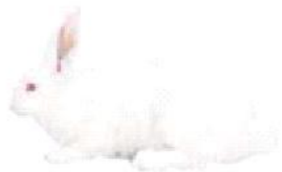
Выращен при 30°C

Проявление аллеля himalayan в зависимости от температуры