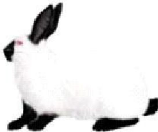
Выращен при 20°C

Примером влияния среды на фенотипическое проявление генотипа может служить окраска меха у кроликов гималайской линии. При одном и том же генотипе эти кролики при выращивании на холоде имеют чёрный мех, при умеренной температуре — гималайскую окраску (белая с чёрными мордой, ушами, лапами и хвостом), при повышенной температуре — белый мех.