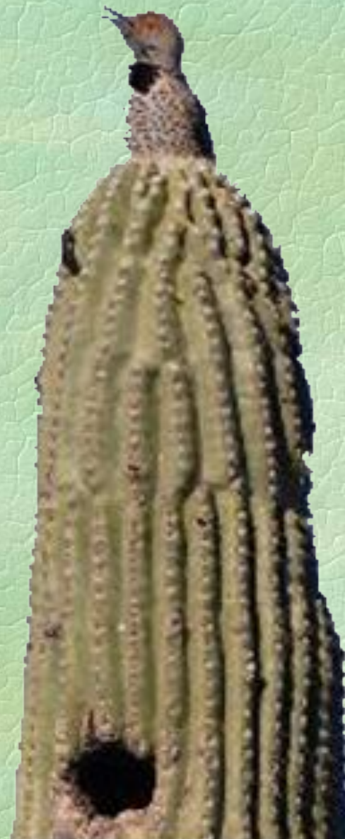
Золотой дятел на кактусе сагуаро в пустыне Сонора, Аризона

Даже при строительстве новых домов или автомагистралей учитывается, не будут ли задеты гигантские суккуленты.