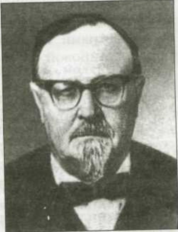
Александр Иванович Опарин (1894–1980)

Второе условие, при котором жизнь может возникнуть, - отсутствие свободного кислорода в атмосфере.