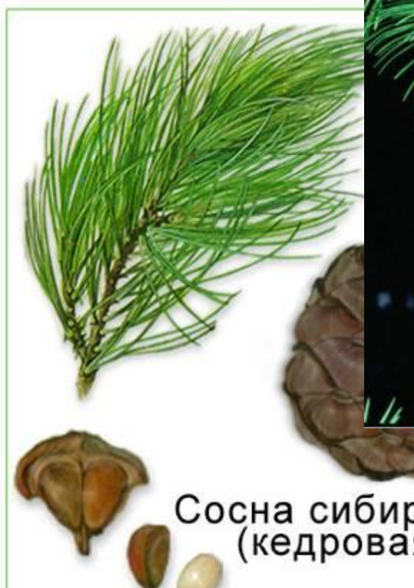
Сосна сибирская (кедровая)

Сосна обыкновенная, сосна сибирская (кедровая), ель,