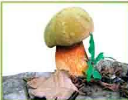
белый гриб (дубовый)