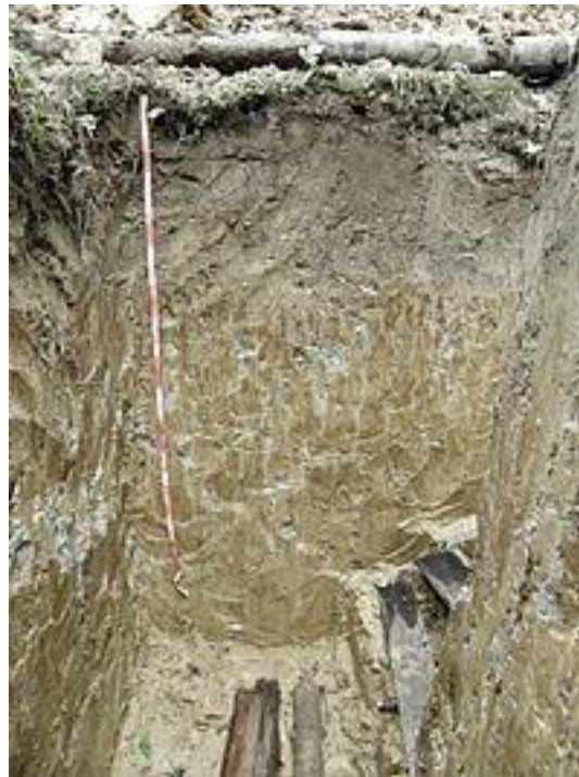
Бурий (лісовий) ґрунт