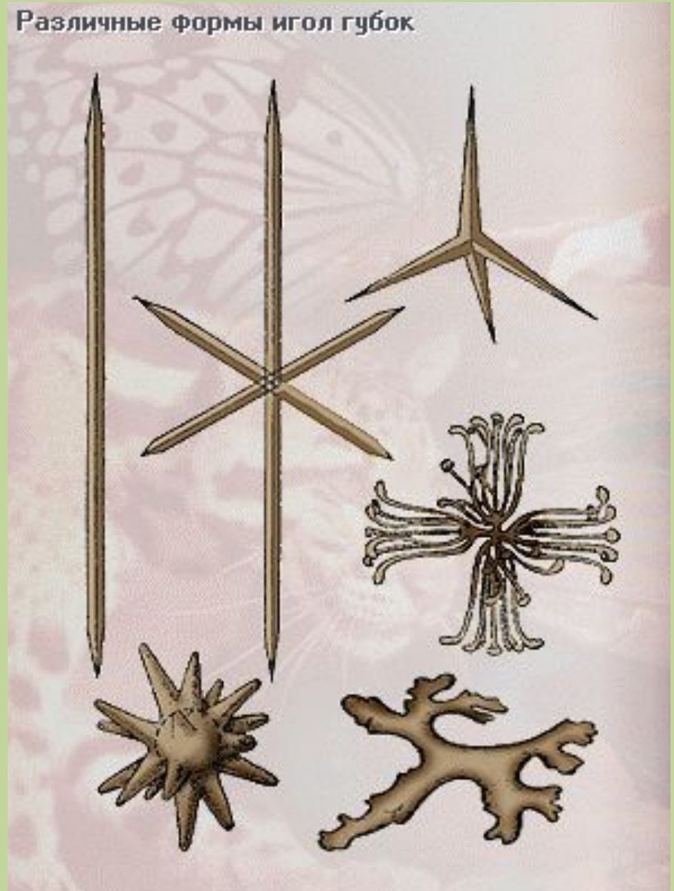
Различные формы игол губок

Иглы имеют разнообразную форму и размеры.