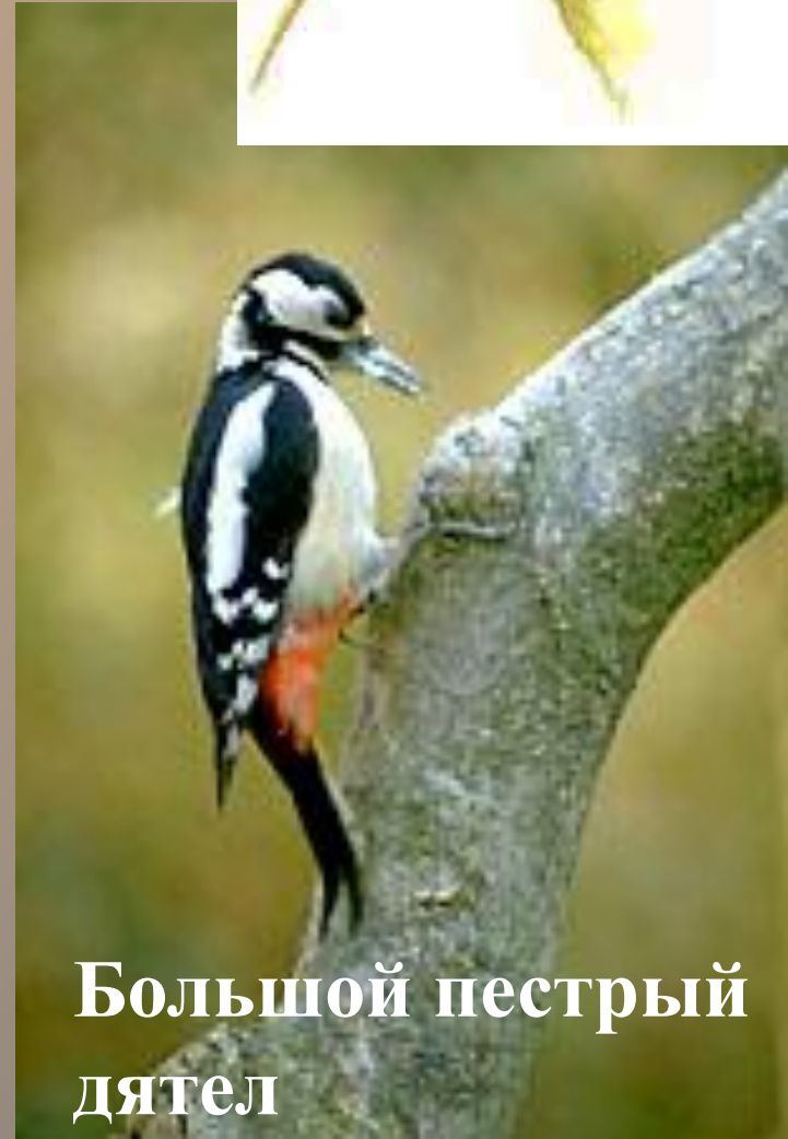
Большой пестрый дятел