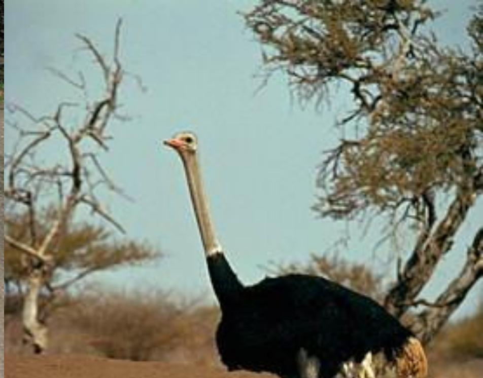
Африканский Страус самец