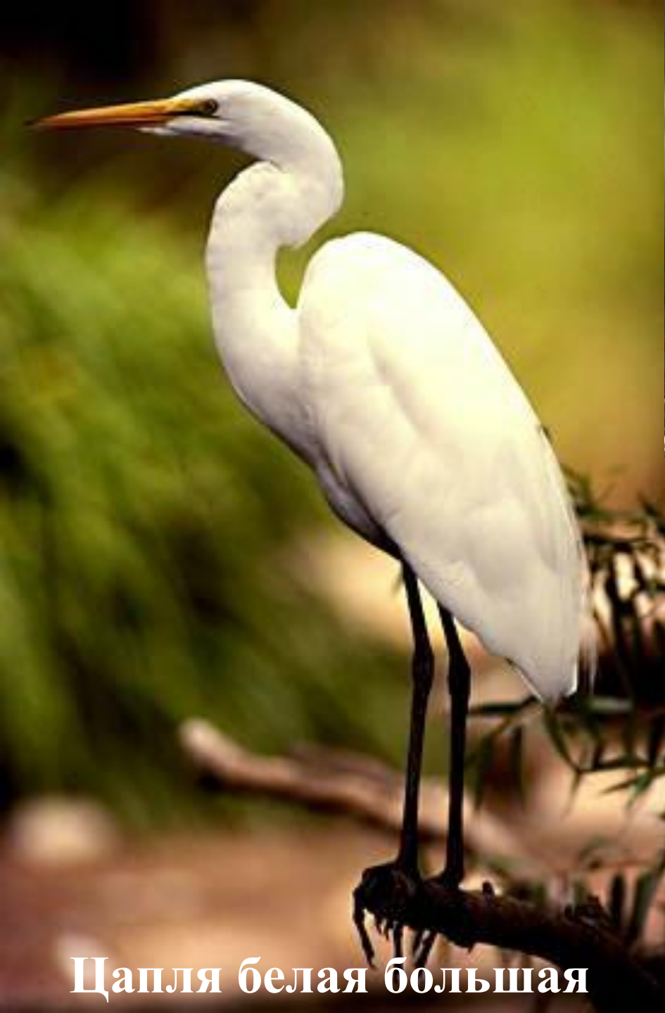
Цапля белая большая