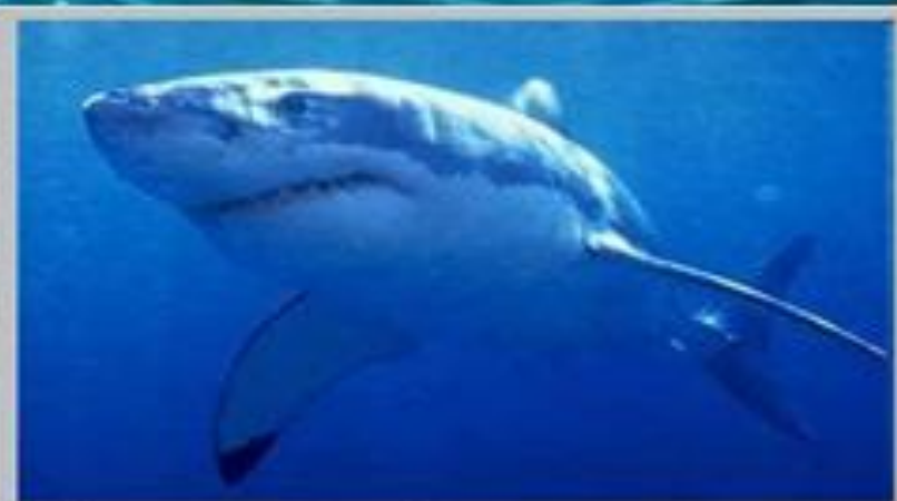
Большая белая акула