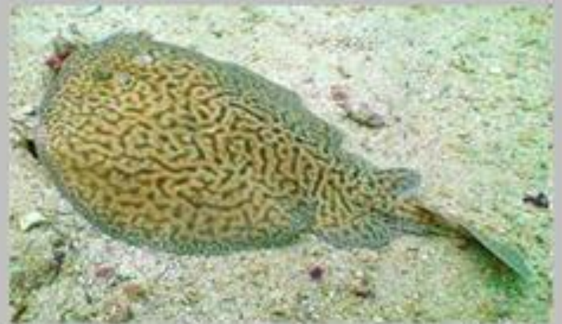
Мраморный электрический скат