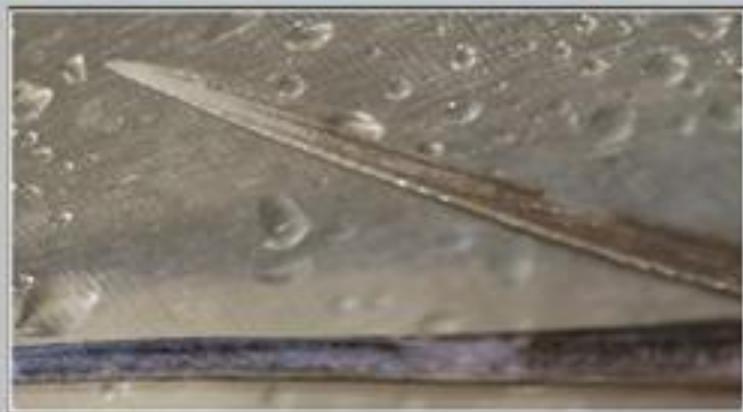
Шип ската хвостокола