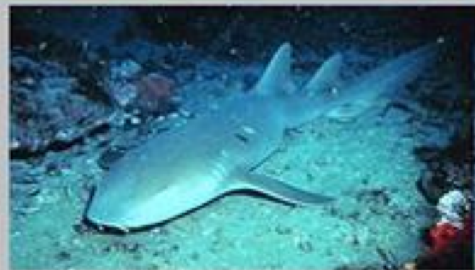
Усатая акула - нянька