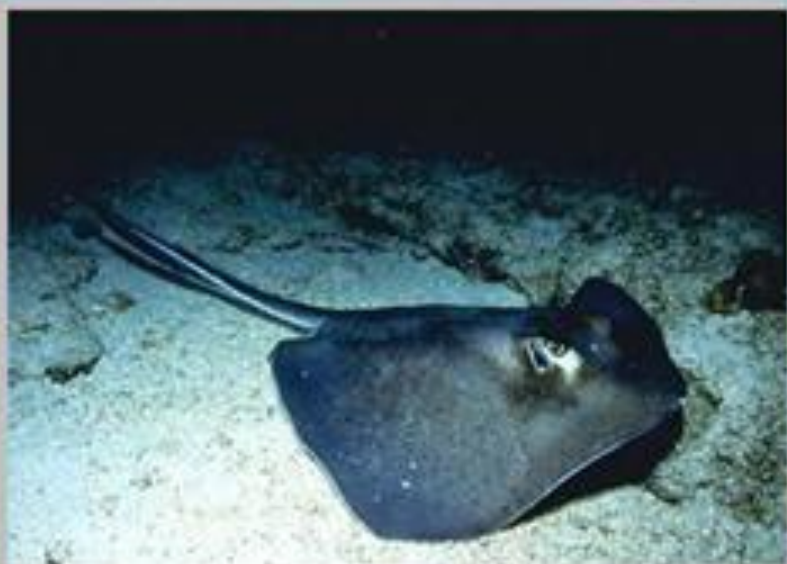
Скат хвостокол Морской черт