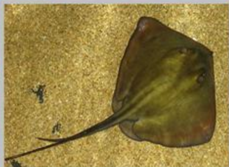
Скат хвостокол Морской кот