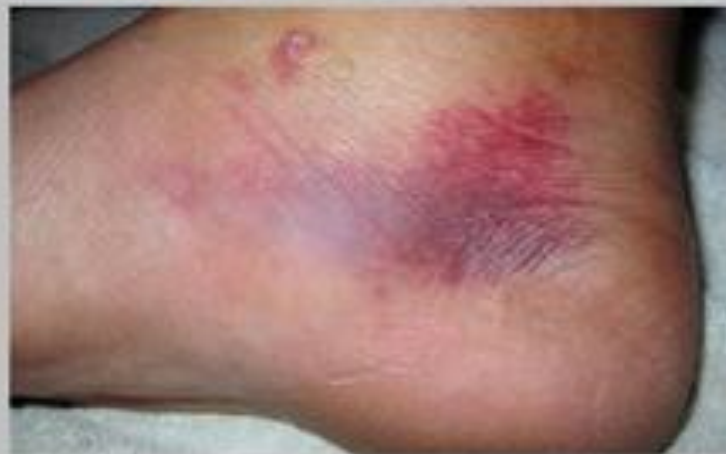
Ожоги от столкновения с электрическим скатом