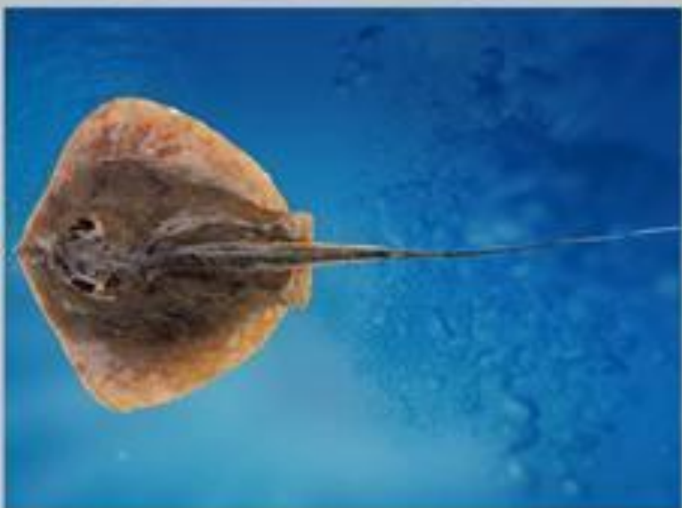
Гигантский скат хвостокол