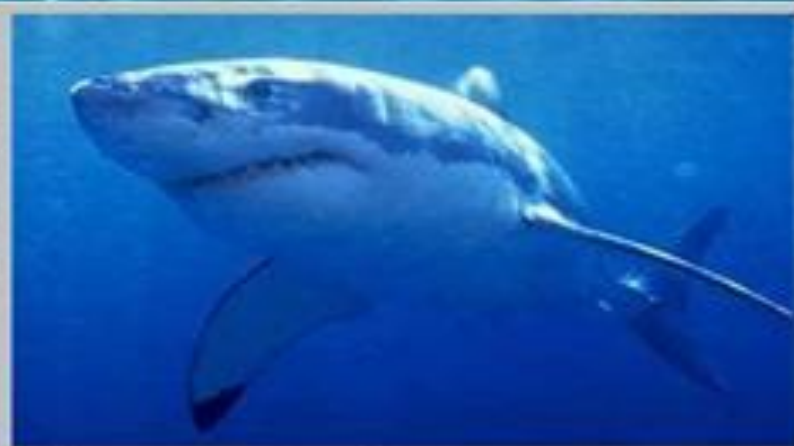
Большая белая акула