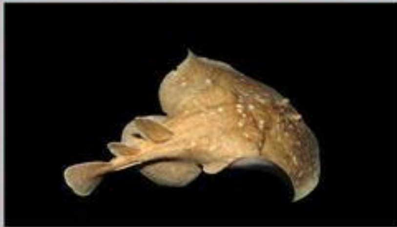
Леопардовый электрический скат