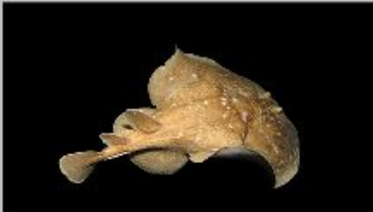
Леопардовый электрический скат