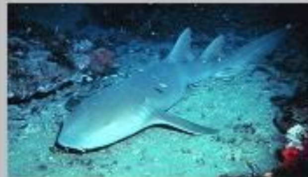
Усатая акула - нянька