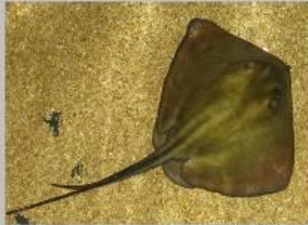
Скат хвостокол Морской кот