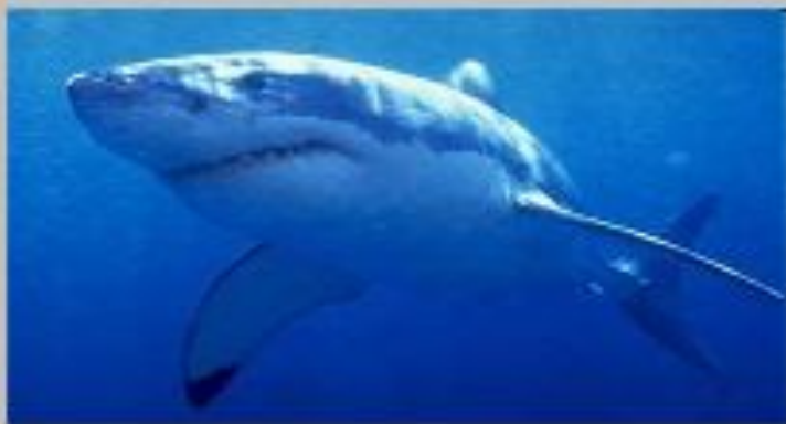
Большая белая акула