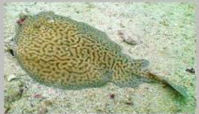
Мраморный электрический скат