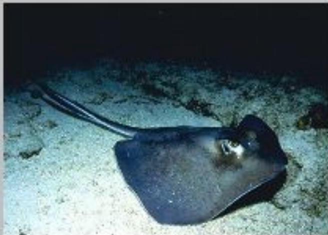
Скат хвостокол Морской черт