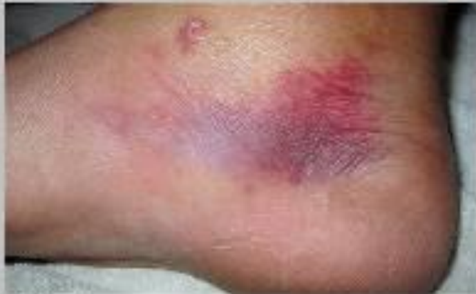
Ожоги от столкновения с электрическим скатом