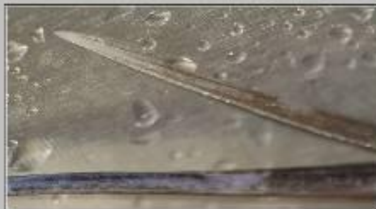
Шип ската хвостокола