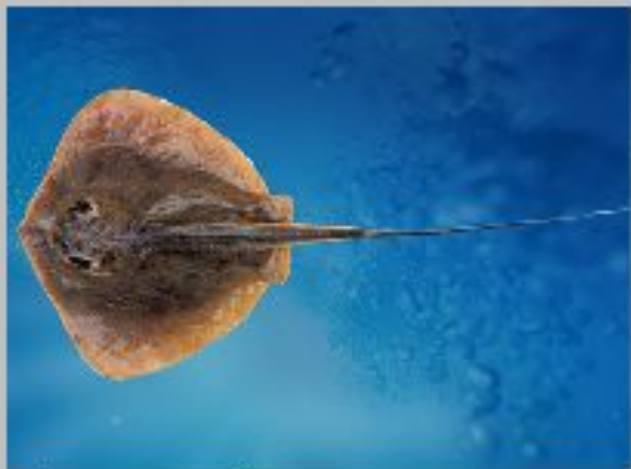
Гигантский скат хвостокол