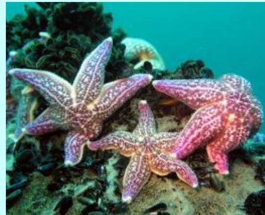
Обыкновенная амурская звезда