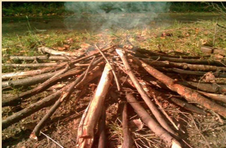
4) «Три бревна»