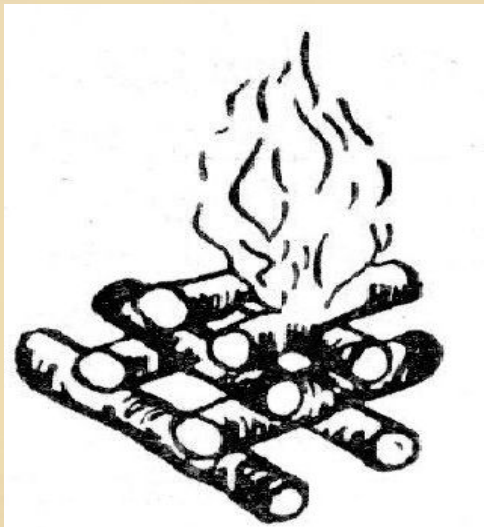
1) «Колодец» или «сруб»