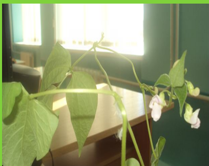
Фото факты нашей работы!