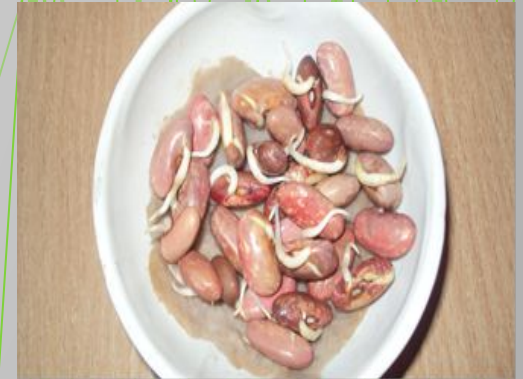
Фасоль- объект исследования