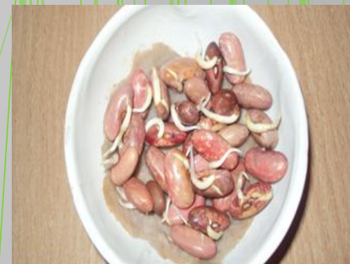
Фасоль- объект исследования