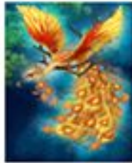
3) ЖАР ПТИЦА