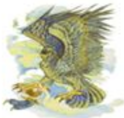
4) ПТИЦА РИХ