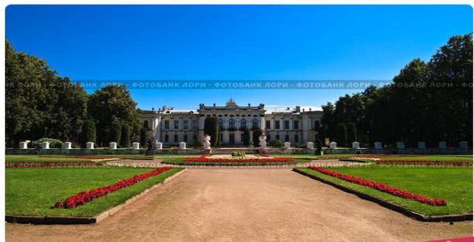
Московская сельскохозяйственная академия-Российский государственный аграрный университет имени К.А. Тимирязева