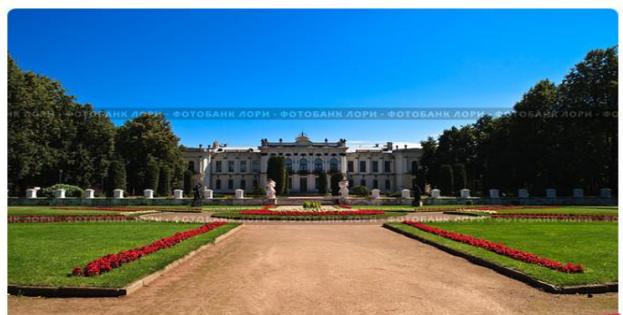
Московская сельскохозяйственная академия-Российский государственный аграрный университет имени К.А. Тимирязева