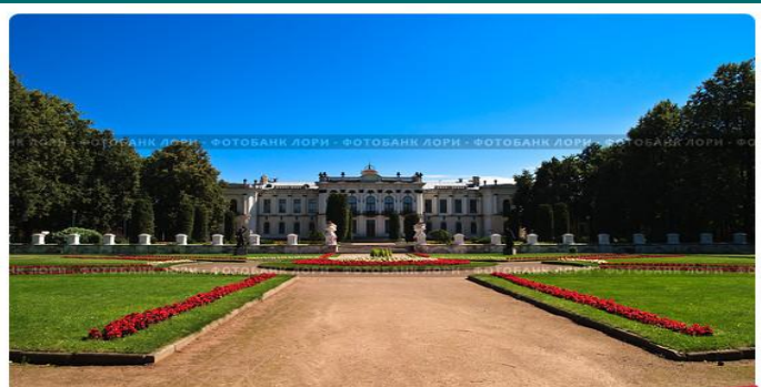
Московская сельскохозяйственная академия-Российский государственный аграрный университет имени К.А. Тимирязева