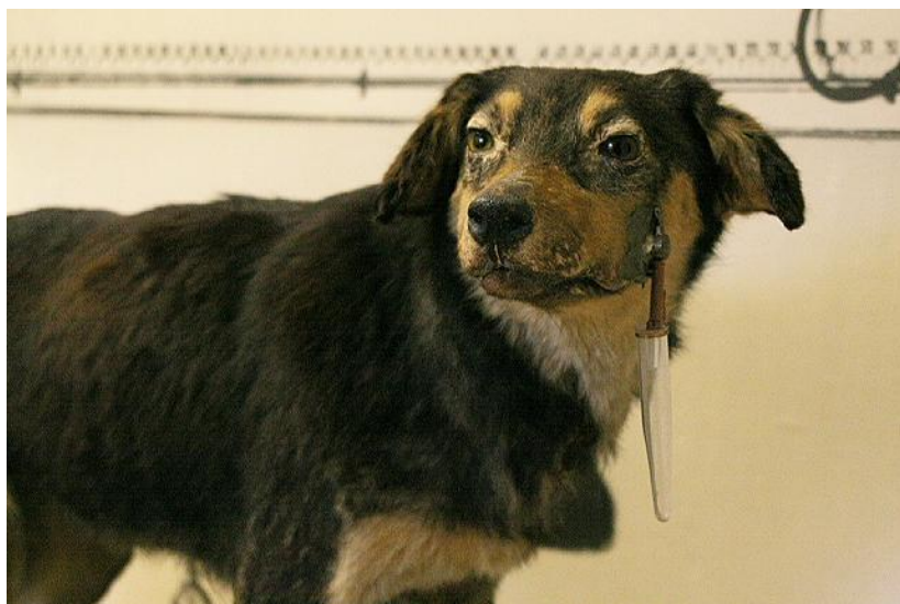
Собака Павлова, Музей Павлова, 2005

В Мадридском докладе, сделанном на русском языке, И. П. Павлов впервые сформулировал принципы физиологии высшей нервной деятельности, которой он и посвятил последующие 35 лет своей жизни. Такие понятия как подкрепление, безусловный и условный рефлексы, стали основными понятиями науки о поведении