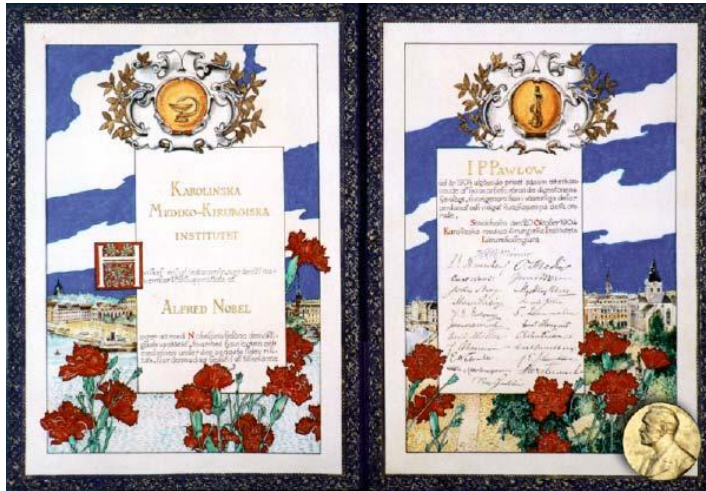
Диплом и золотая медаль лауреата Нобелевской премии 1904 года

В 1903 году 54-летний Павлов сделал доклад на XIV Международном Медицинском Конгрессе в Мадриде. И в следующем, 1904 году, Нобелевская премия за исследование функций главных пищеварительных желез была вручена И. П. Павлову, — он стал первым российским Нобелевским лауреатом