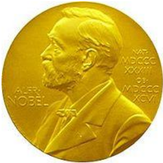
Медаль, вручаемая лауреату Нобелевской премии

В 1903 году 54-летний Павлов сделал доклад на XIV Международном Медицинском Конгрессе в Мадриде. И в следующем, 1904 году, Нобелевская премия за исследование функций главных пищеварительных желез была вручена И. П. Павлову, — он стал первым российским Нобелевским лауреатом