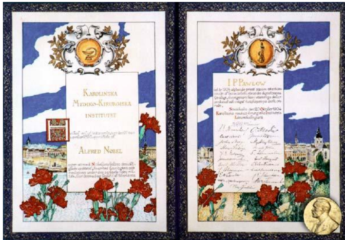
Диплом и золотая медаль лауреата Нобелевской премии 1904 года

В 1903 году 54-летний Павлов сделал доклад на XIV Международном Медицинском Конгрессе в Мадриде. И в следующем, 1904 году, Нобелевская премия за исследование функций главных пищеварительных желез была вручена И. П. Павлову, — он стал первым российским Нобелевским лауреатом