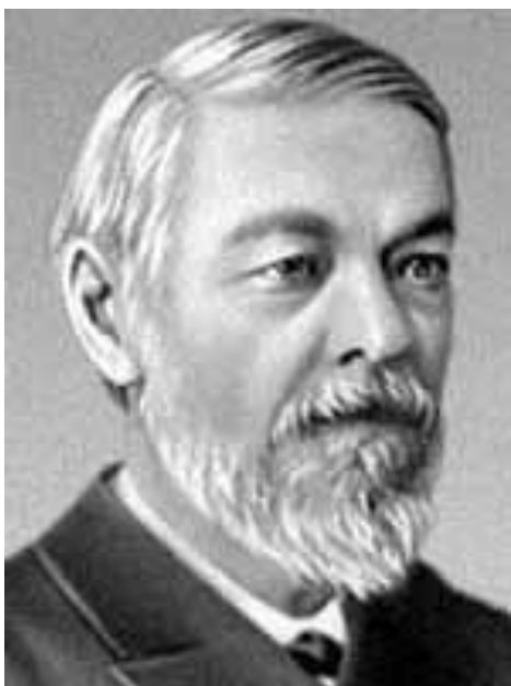
И. М. Сеченов