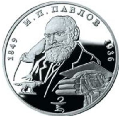
Серебряная памятная монета Банка России, посвящённая 150- летию со дня рождения И. П. Павлова, 1999 г.

1890 — избран профессором и заведующим кафедрой фармакологии ВМА, а в 1896 — заведующим кафедрой физиологии, которой руководил до 1924. Одновременно (с 1890) Павлов — заведующий физиологической лабораторией при организованном тогда институте экспериментальной медицины.