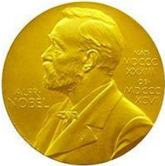
Медаль, вручаемая лауреату Нобелевской премии

В 1903 году 54-летний Павлов сделал доклад на XIV Международном Медицинском Конгрессе в Мадриде. И в следующем, 1904 году, Нобелевская премия за исследование функций главных пищеварительных желез была вручена И. П. Павлову, — он стал первым российским Нобелевским лауреатом