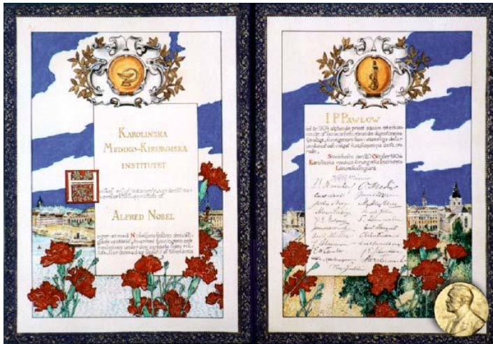
Диплом и золотая медаль лауреата Нобелевской премии 1904 года

В 1903 году 54-летний Павлов сделал доклад на XIV Международном Медицинском Конгрессе в Мадриде. И в следующем, 1904 году, Нобелевская премия за исследование функций главных пищеварительных желез была вручена И. П. Павлову, — он стал первым российским Нобелевским лауреатом