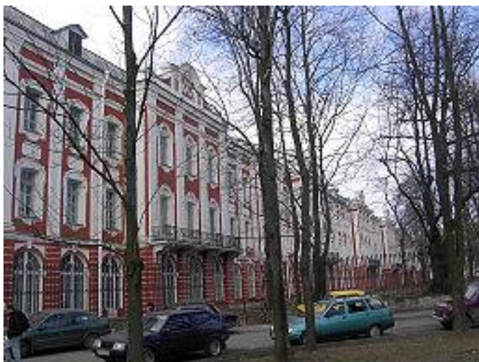
Главный фасад здания Двенадцати коллегий, выходящий на Менделеевскую линию. Современный вид

В 1870 поступил на юридический факультет (семинаристы были ограничены в выборе университетских специальностей), но через 17 дней после поступления перешёл на естественное отделение физико-математического факультета Петербургского университета (специализировался по физиологии)