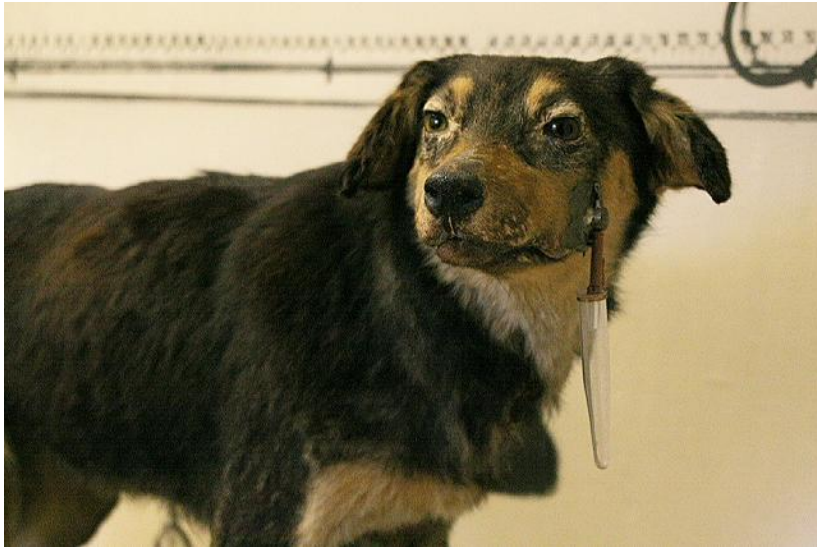
Собака Павлова, Музей Павлова, 2005

В Мадридском докладе, сделанном на русском языке, И. П. Павлов впервые сформулировал принципы физиологии высшей нервной деятельности, которой он и посвятил последующие 35 лет своей жизни. Такие понятия как подкрепление, безусловный и условный рефлекс, стали основными понятиями науки о поведении