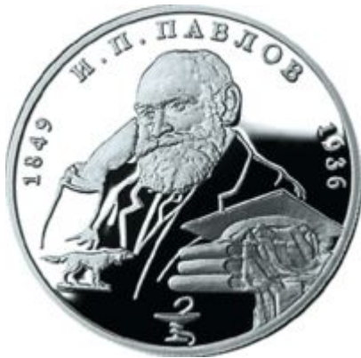
Серебряная памятная монета Банка России, посвящённая 150- летию со дня рождения И. П. Павлова, 1999 г.

1890 — избран профессором и заведующим кафедрой фармакологии ВМА, а в 1896 — заведующим кафедрой физиологии, которой руководил до 1924. Одновременно (с 1890) Павлов — заведующий физиологической лабораторией при организованном тогда институте экспериментальной медицины.