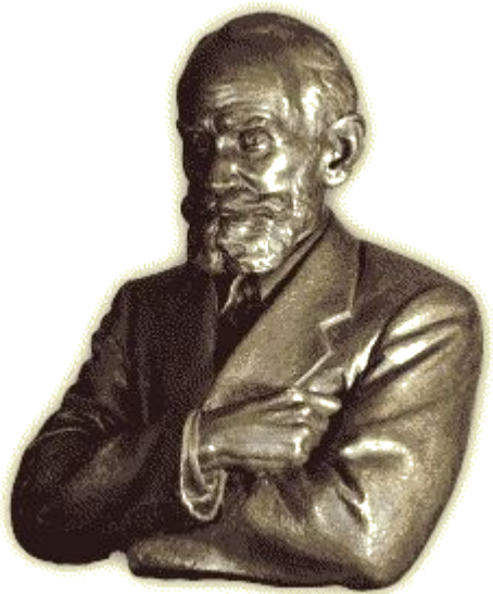
М.Г. Манизер Бюст И.П. Павлова, 1949 год

http://www.venda.ru/project/2007/Katsman/page1.htm