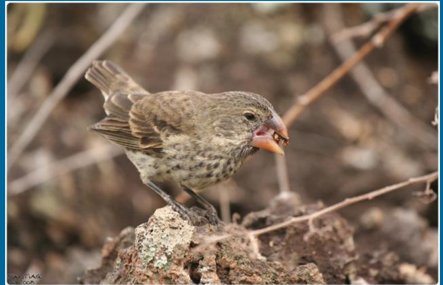
Земляной вьюрок Galapagos Journey.