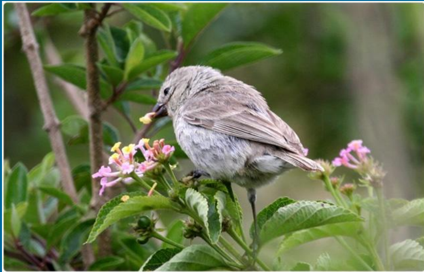
Большой кактусовый вьюрок Galapagos Journey.