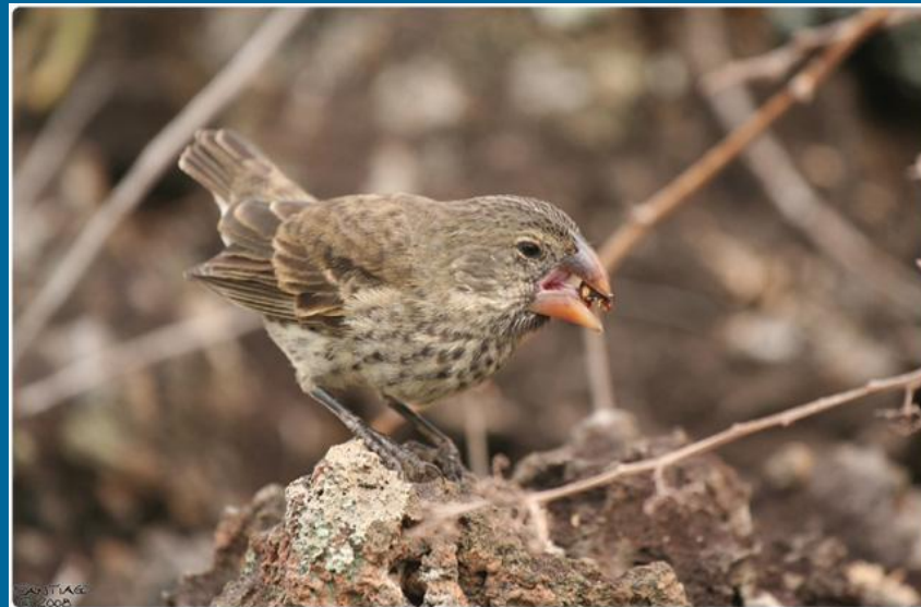
Земляной вьюрок Galapagos Journey.