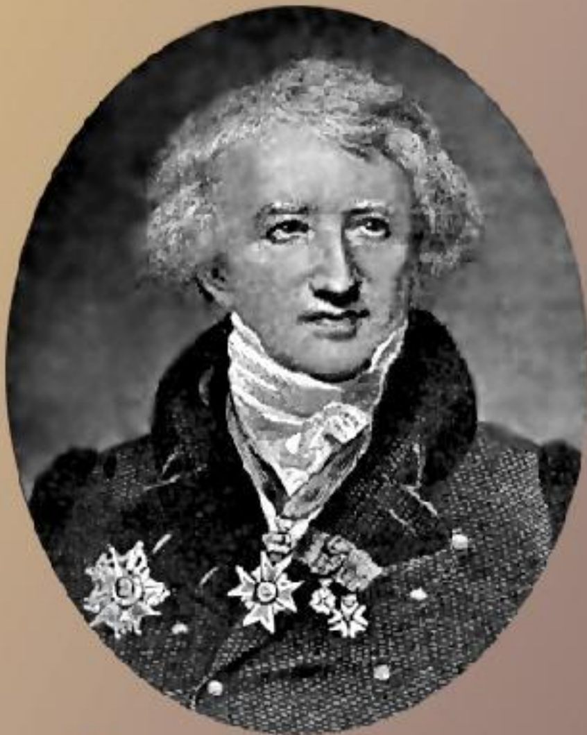
Кювье Жорж (1769 - 1832)

В чем заслуга его учения? ( стр. 352-353)