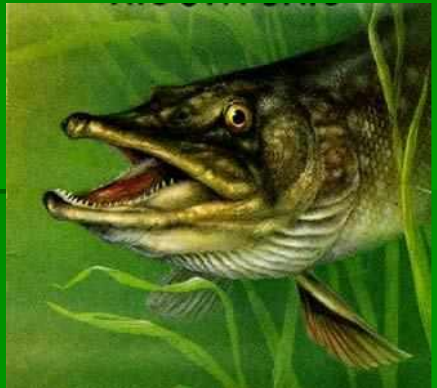
щ у к а