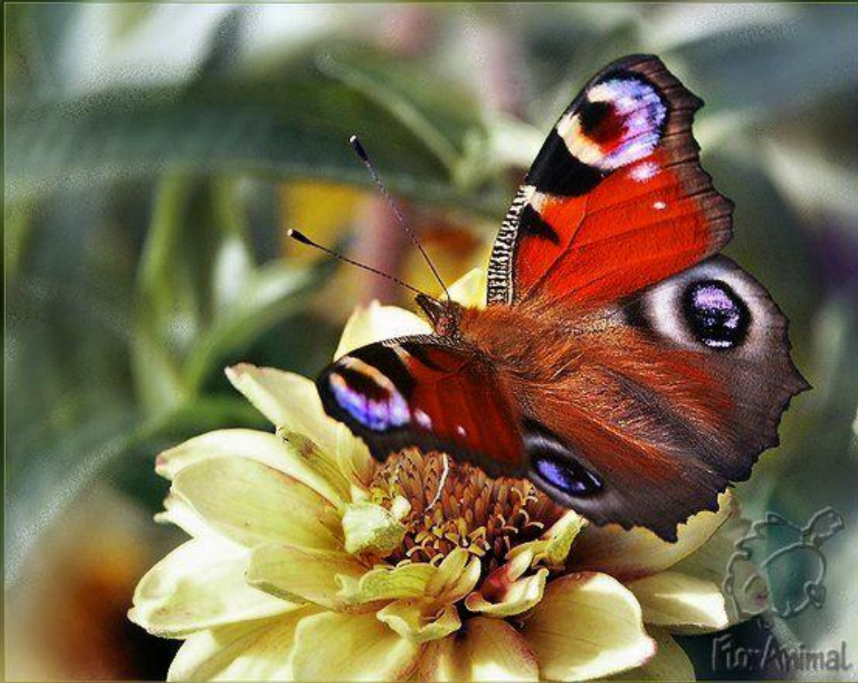
Бабочка павлиний глаз