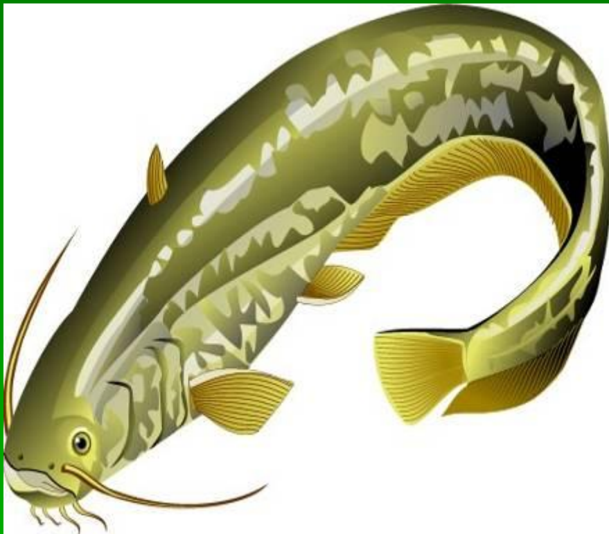
с о м